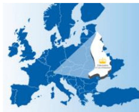
Imagen (2018).

Es importante destacar que el Principado de Liechtenstein 6 además de ser miembro de la EFTA, desde la conclusión del Tratado de Aduanas en 1923 , ha compartido una zona aduanera común con Suiza , lo que significa que los acuerdos bilaterales de libre comercio entre Suiza y otros países también se aplican a Liechtenstein.